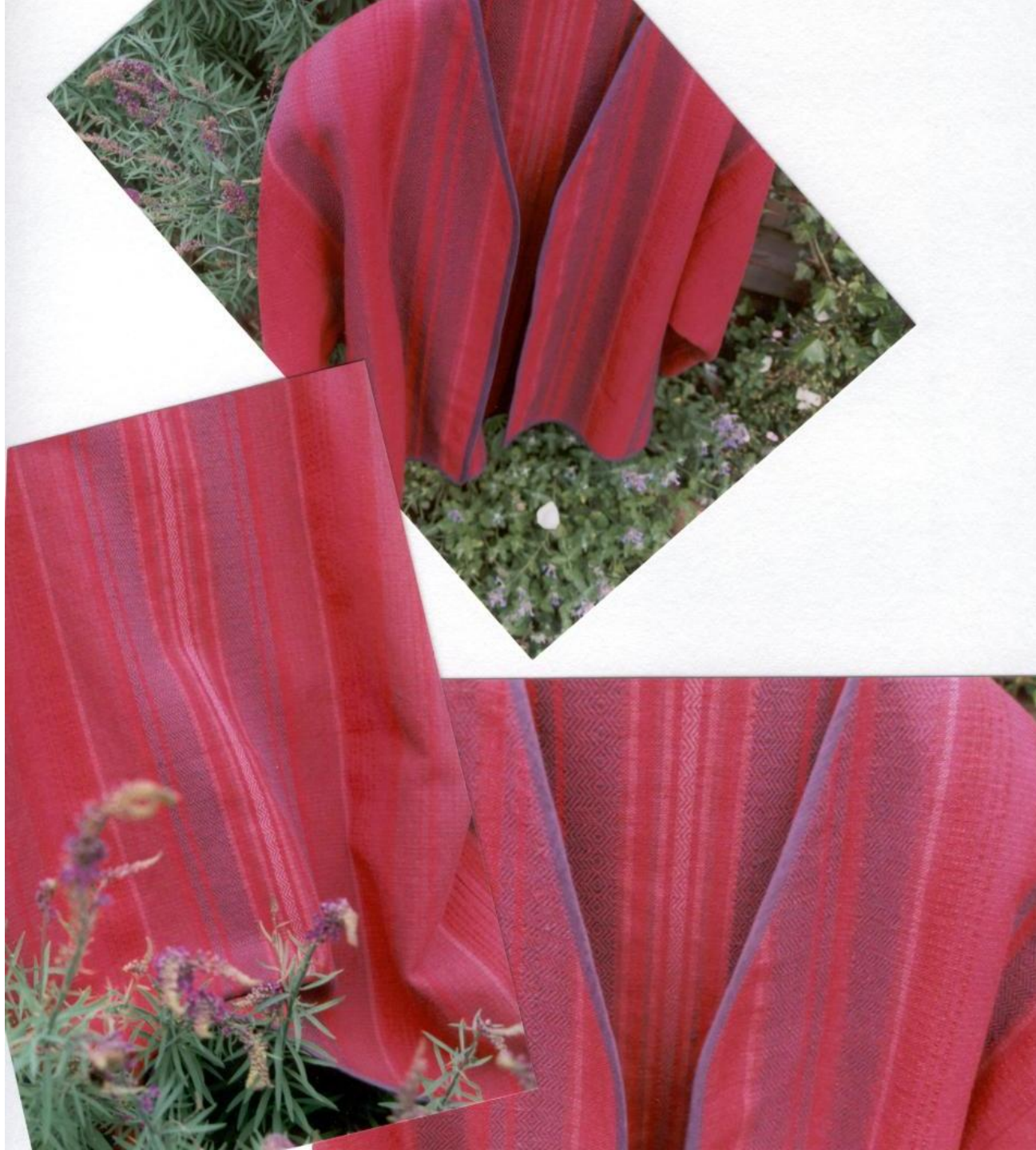
Jas Keperweefsel, katoen.