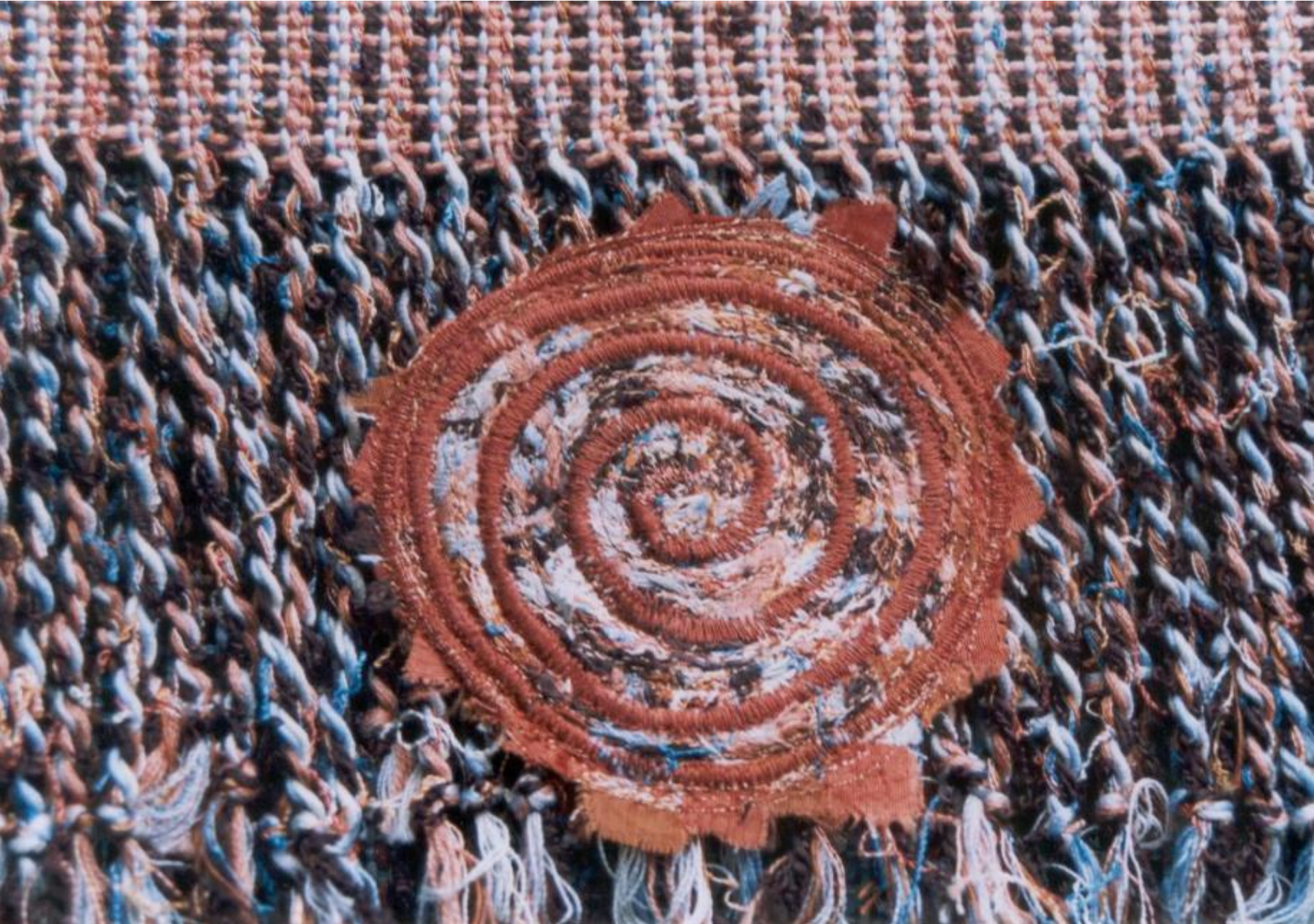
Sjaal - Linnenbinding, katoen.