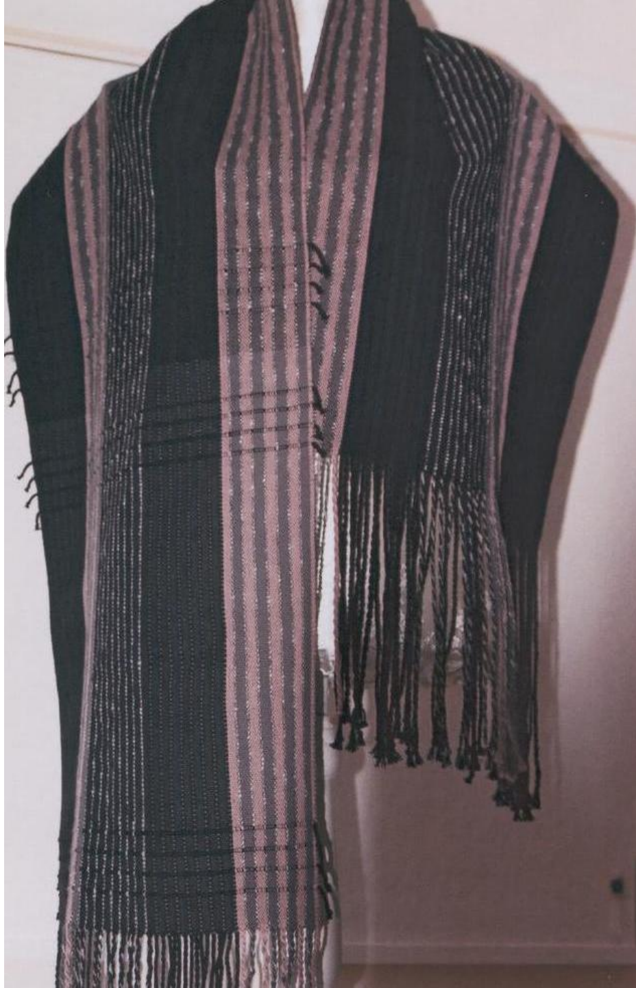
Sjaal Linnenbinding, katoen.