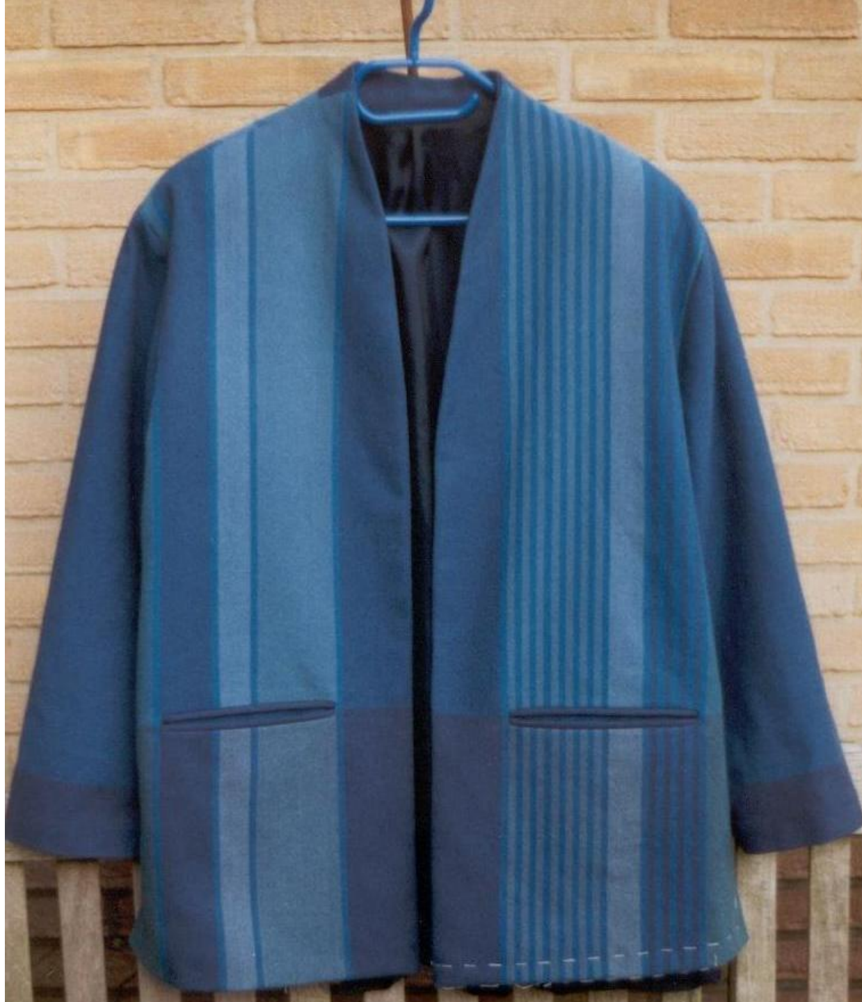
Jas Linnenbinding, katoen.