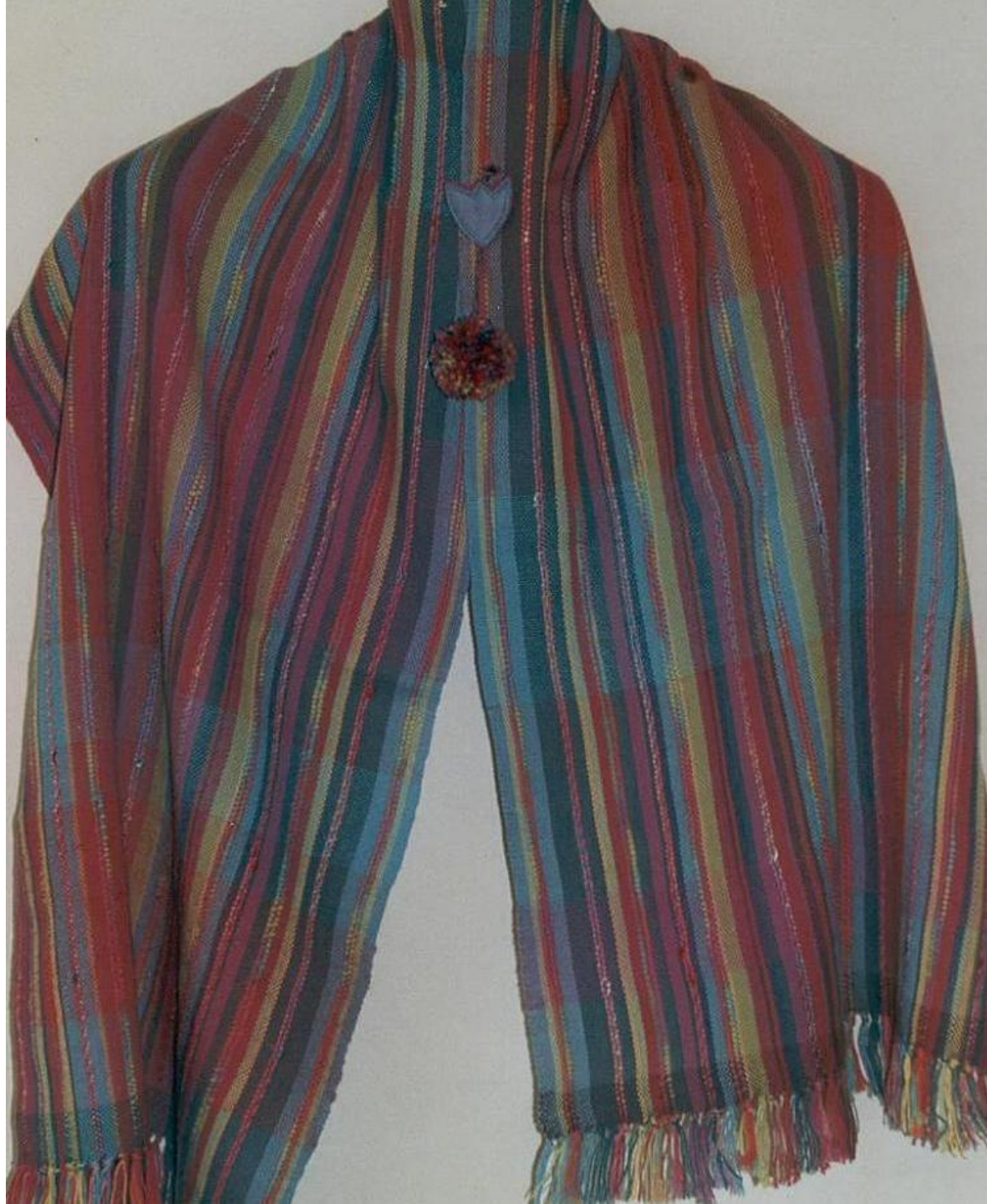
Sjaal Linnenbinding, katoen.