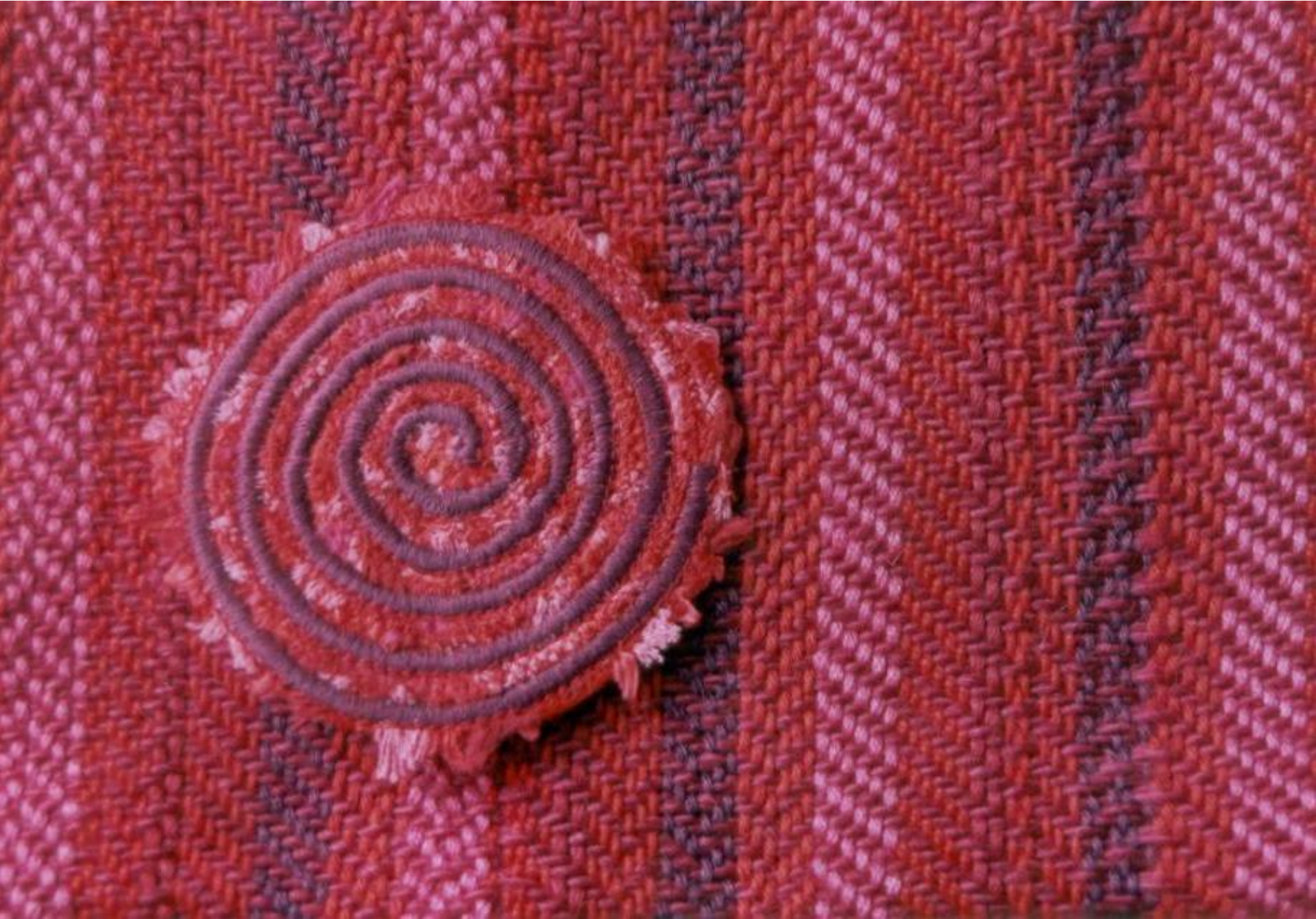
Sjaal - Keperweefsel, katoen.