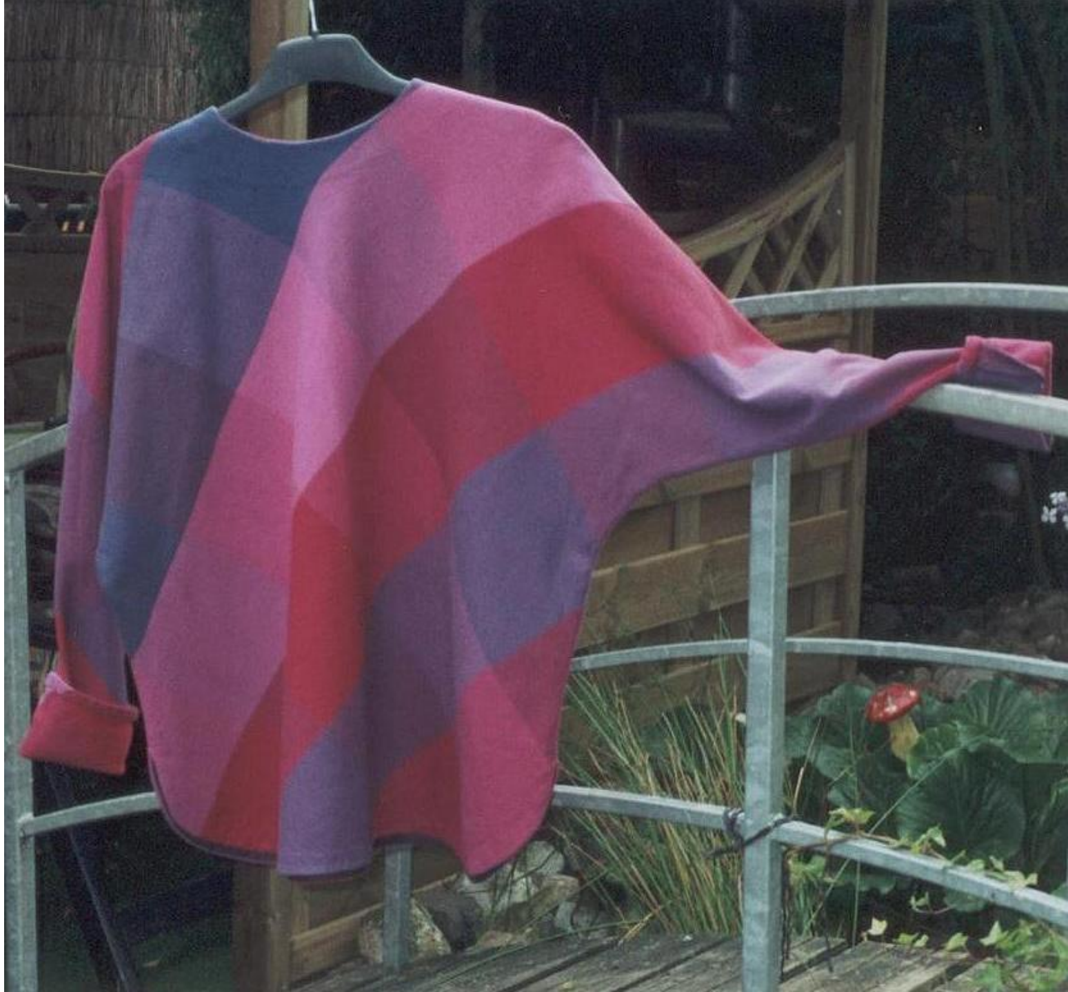
Jas Linnenbinding, katoen.