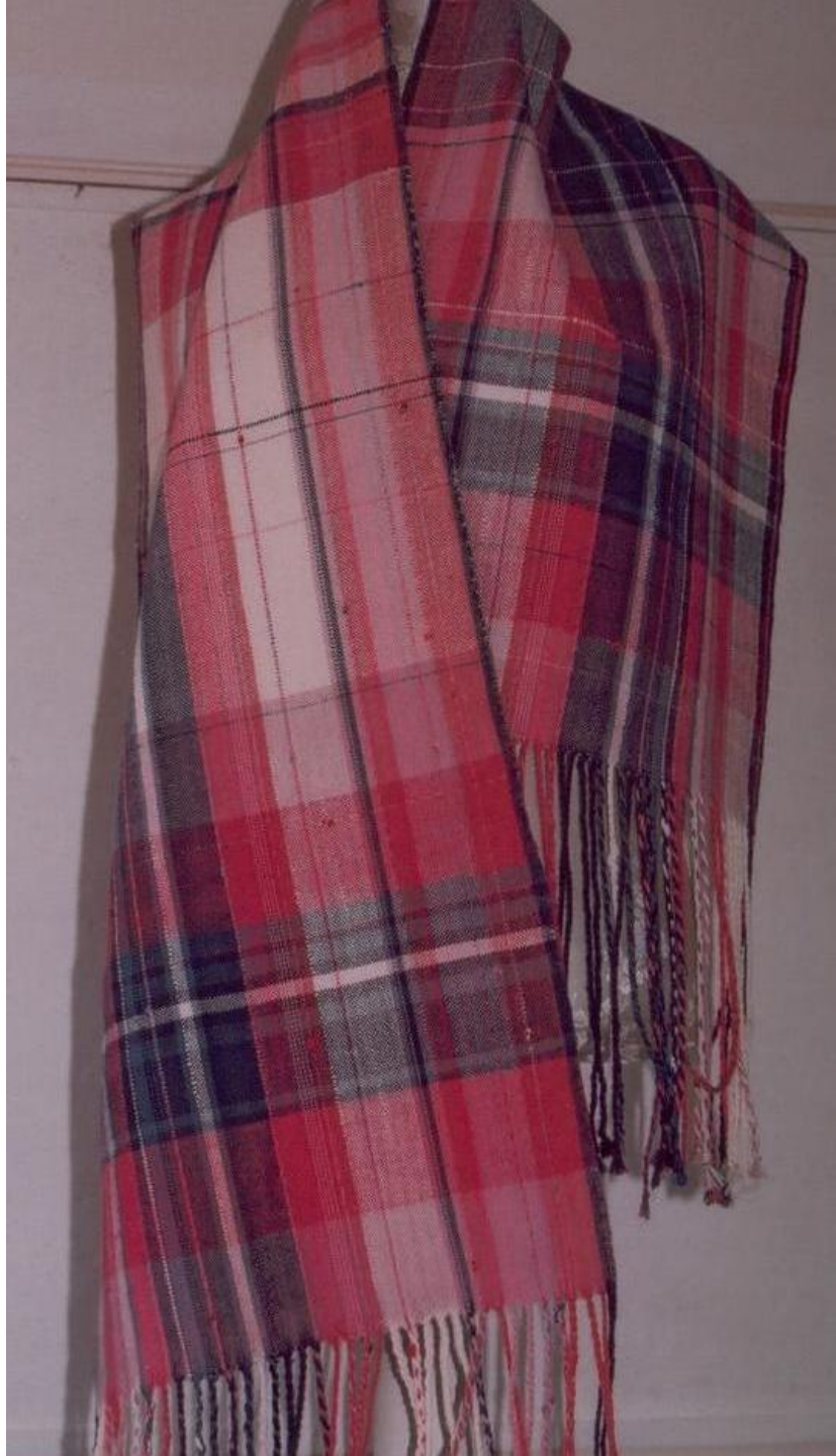
Sjaal Linnenbinding, katoen.