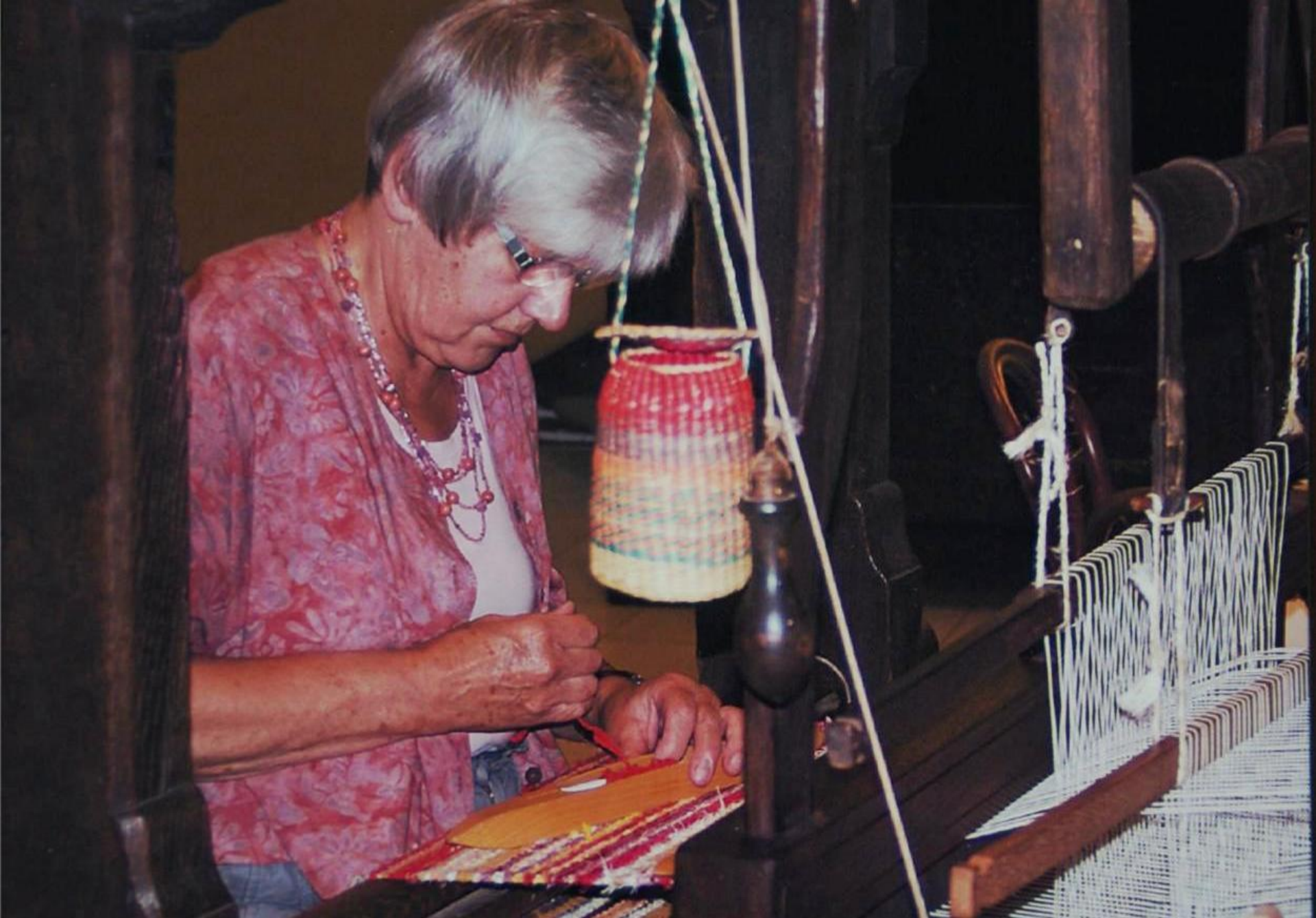
Jassen, sjaals en vesten – een aantal modellen.