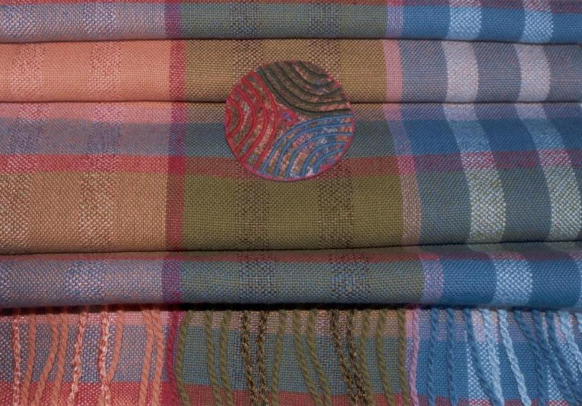
Sjaal - Linnenbinding, katoen.