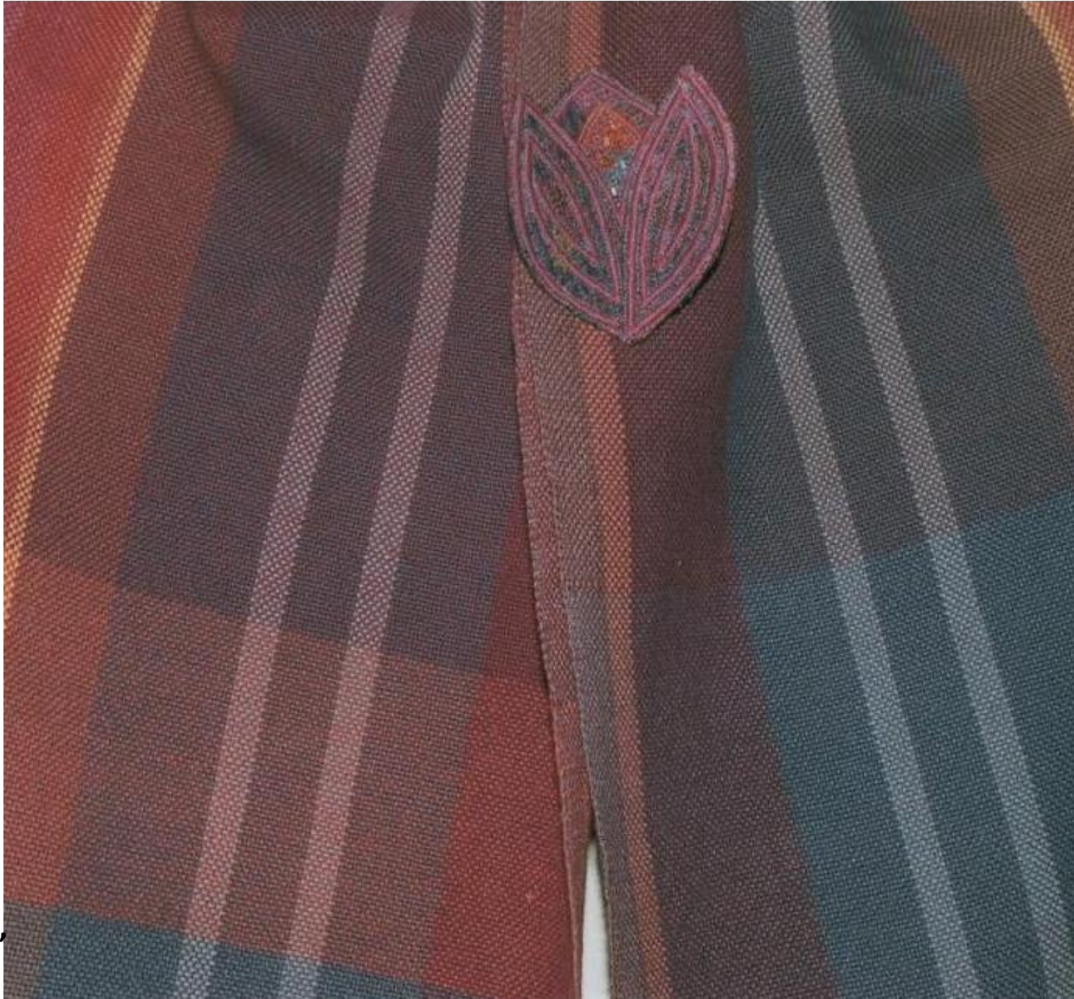
Sjaal Linnenbinding, katoen.