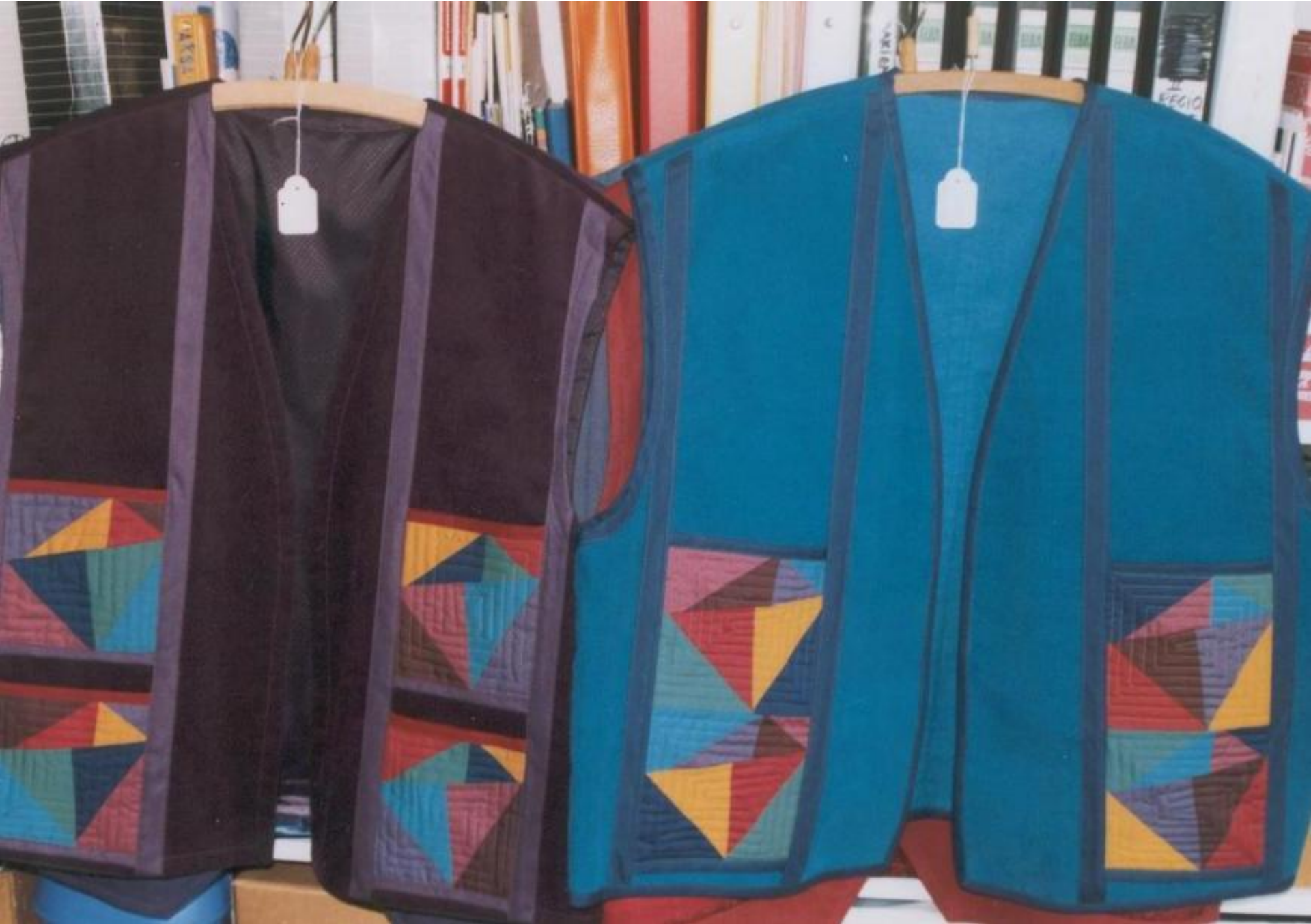
Vesten - Patchwork zakken.