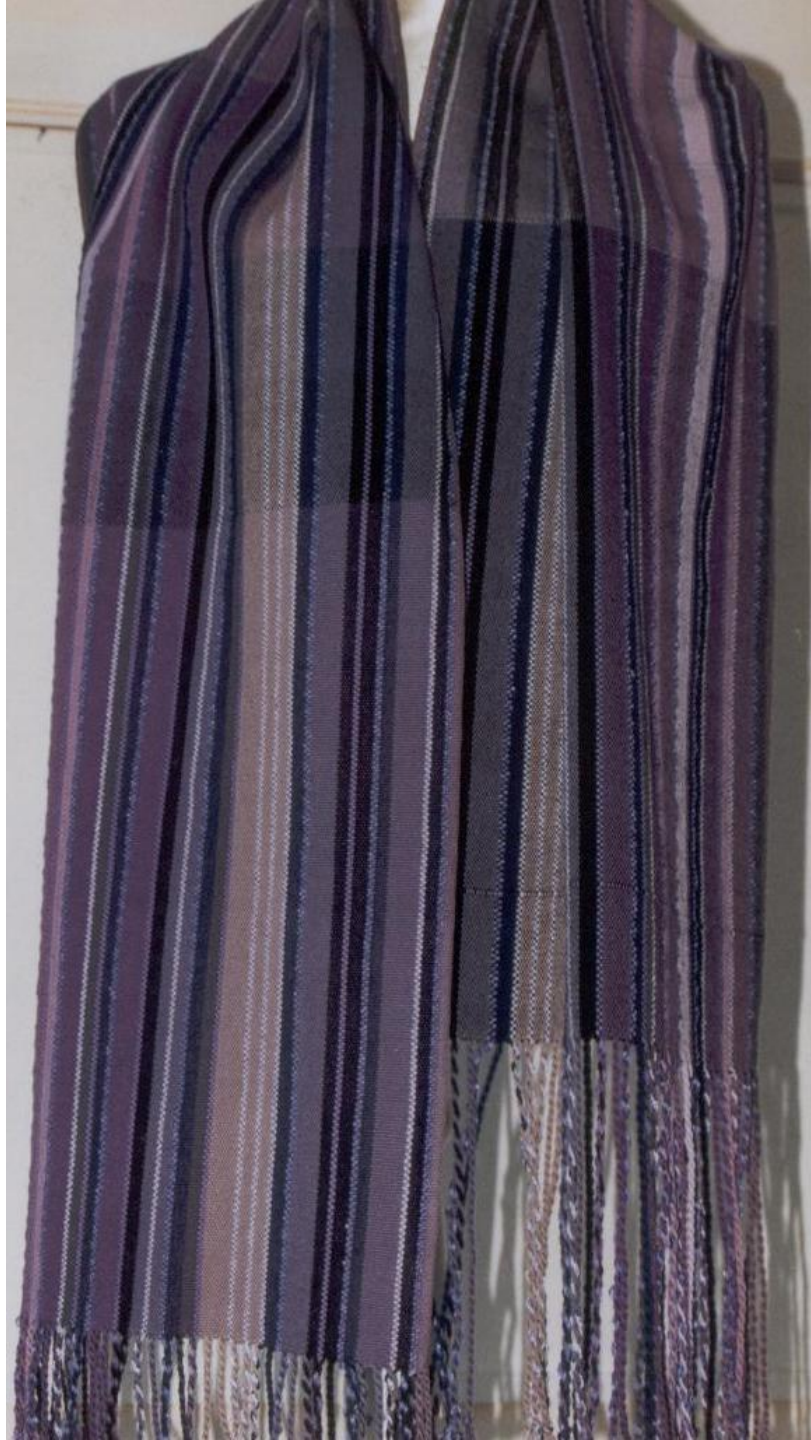
Sjaal Linnenbinding, katoen.