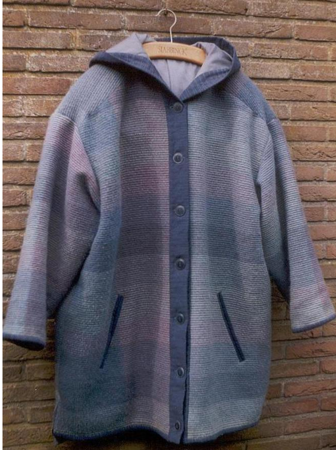
Jas Srilankaans weefsel, katoen en wol.