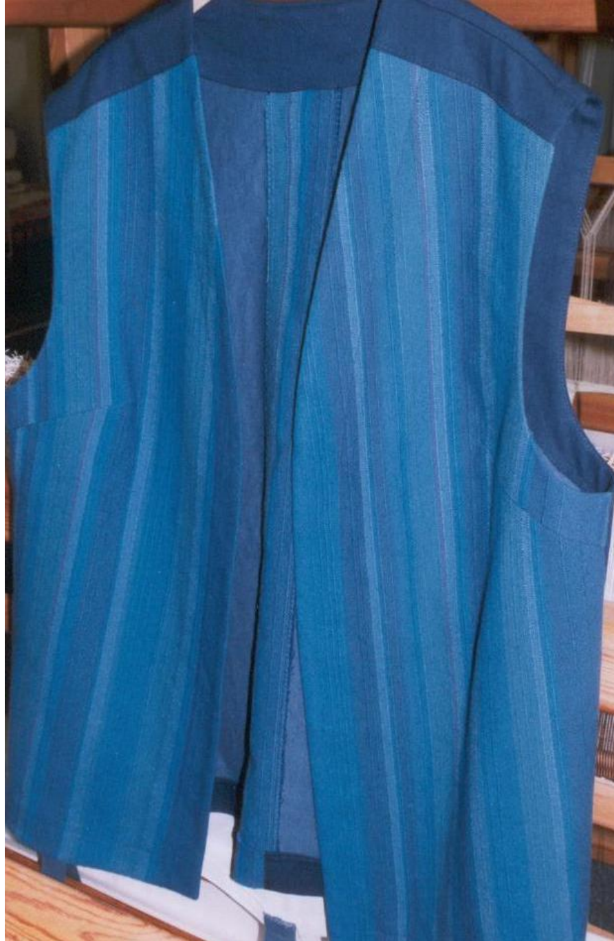
Vest - geweven.