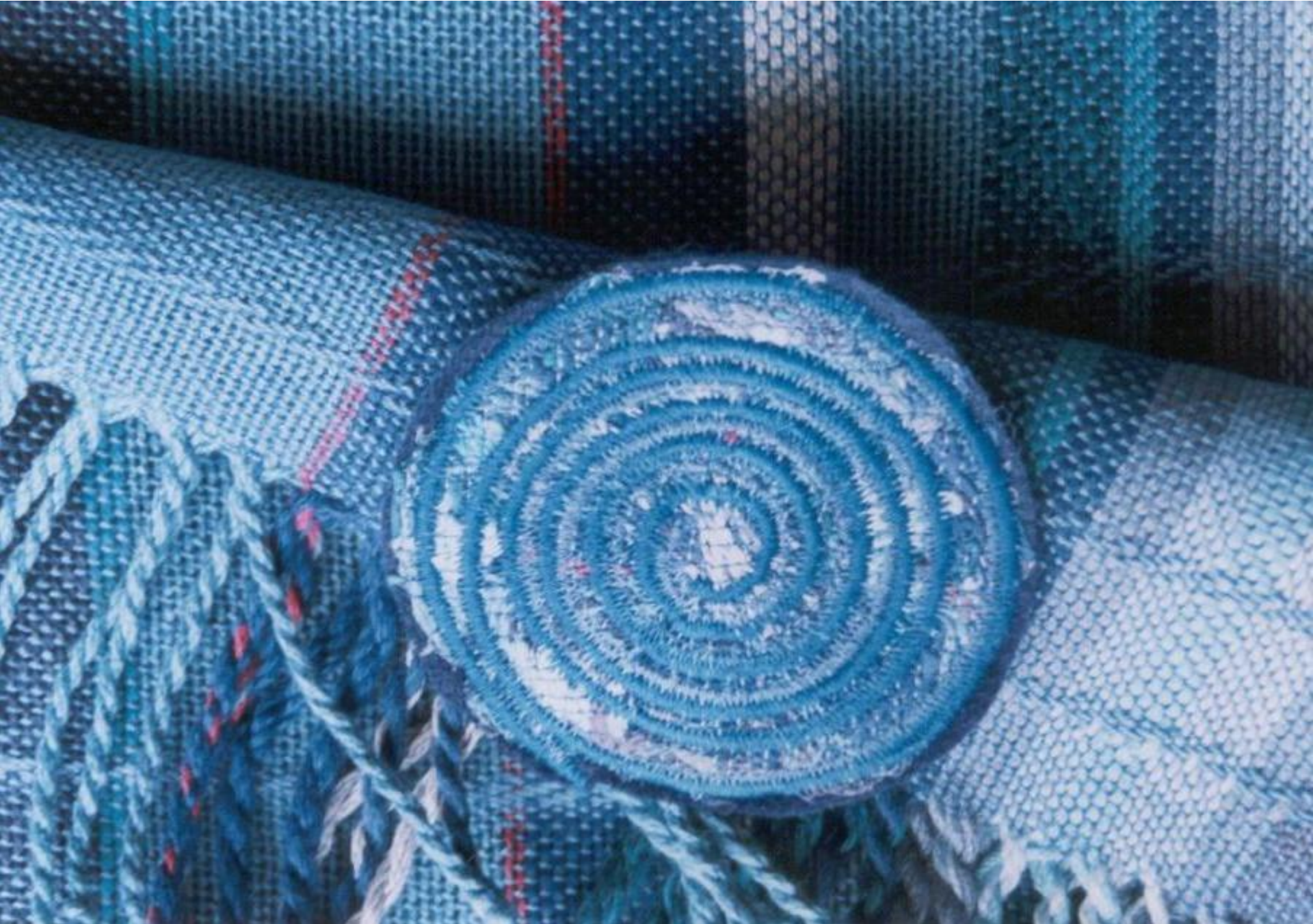
Sjaal - Linnenbinding, katoen.