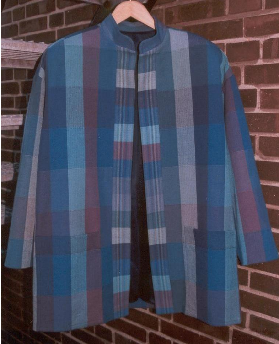
Jas - Linnenbinding, katoen.