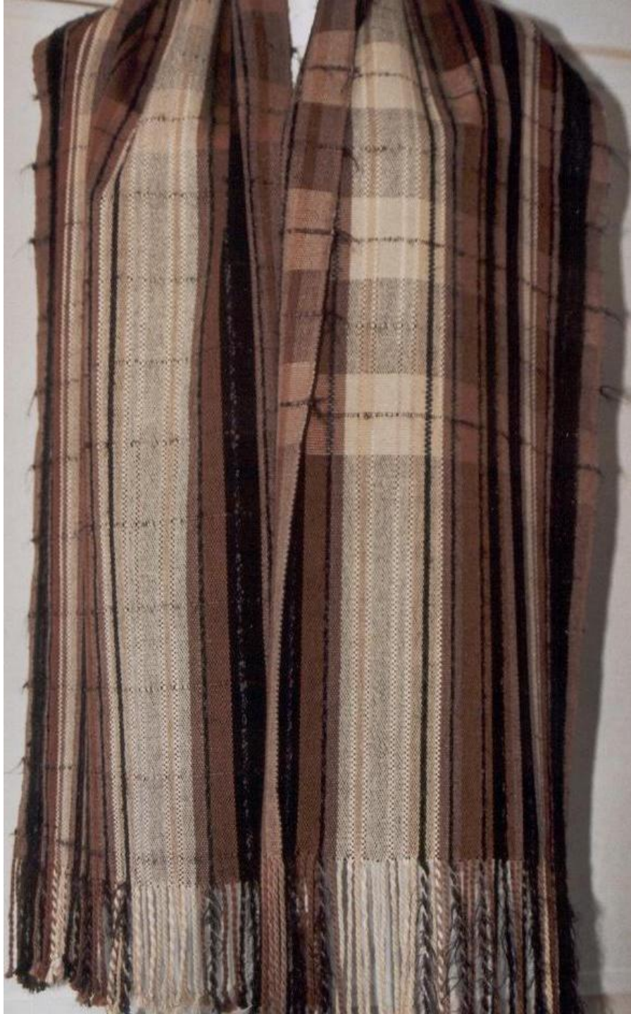
Sjaal Linnenbinding, katoen.