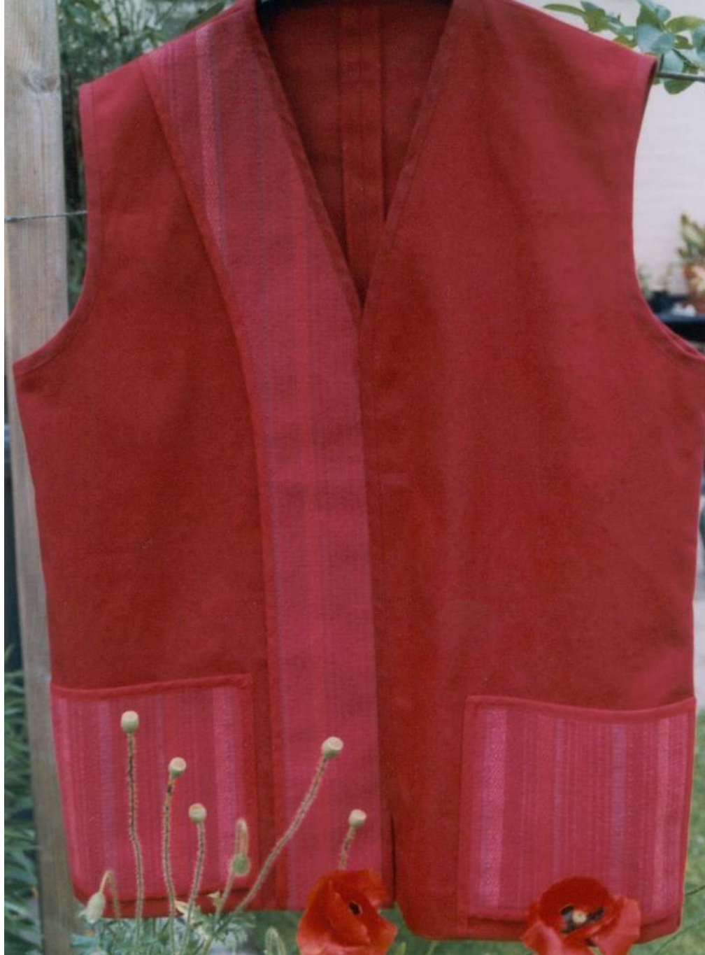
Vest - geweven zakken en voorbies.