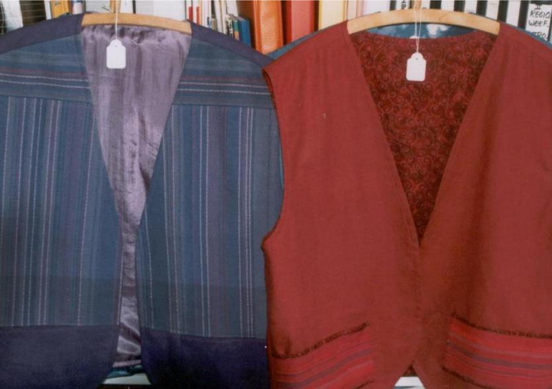
Vesten - geweven panden.