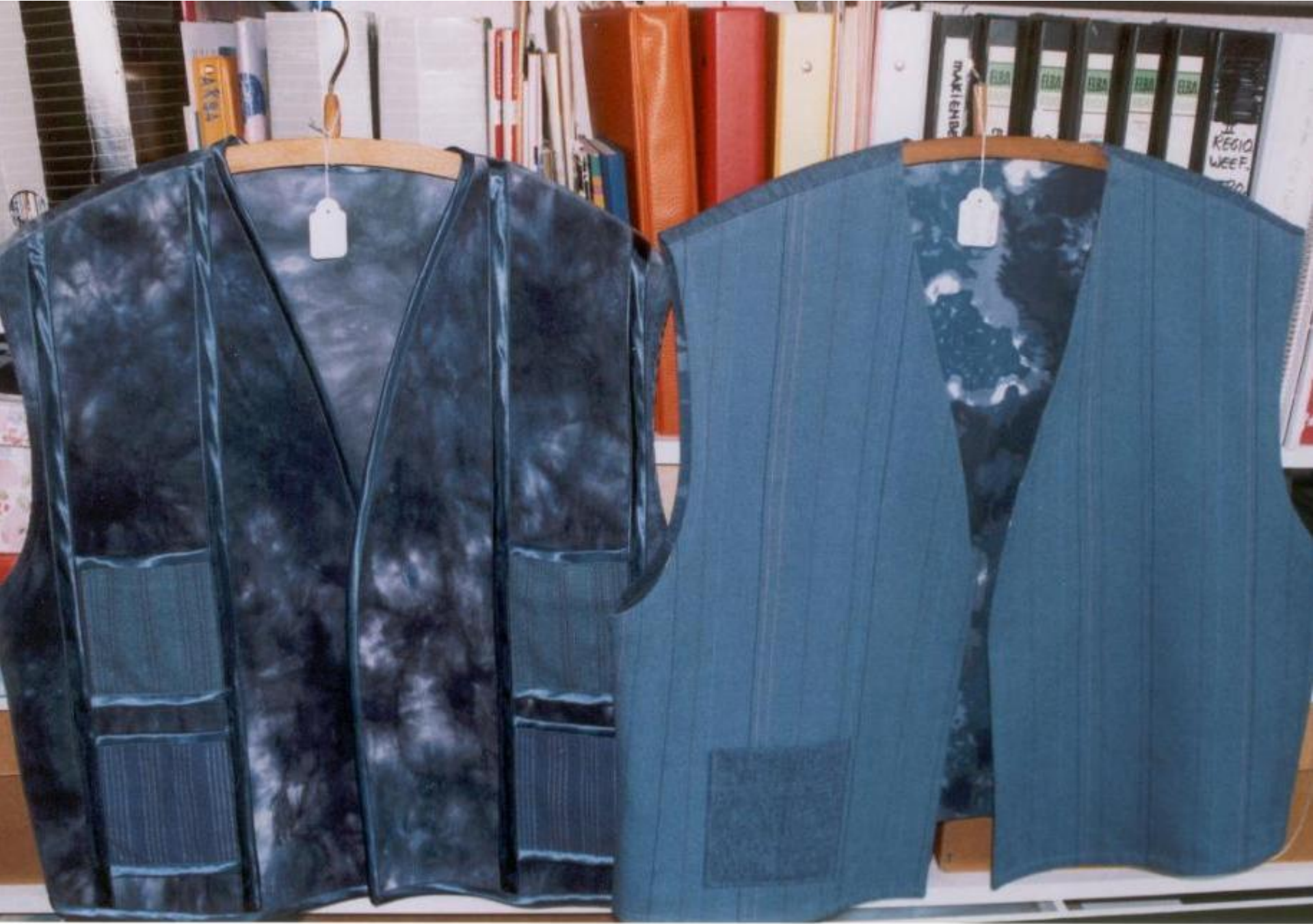
Vesten - geweven panden, zakken.