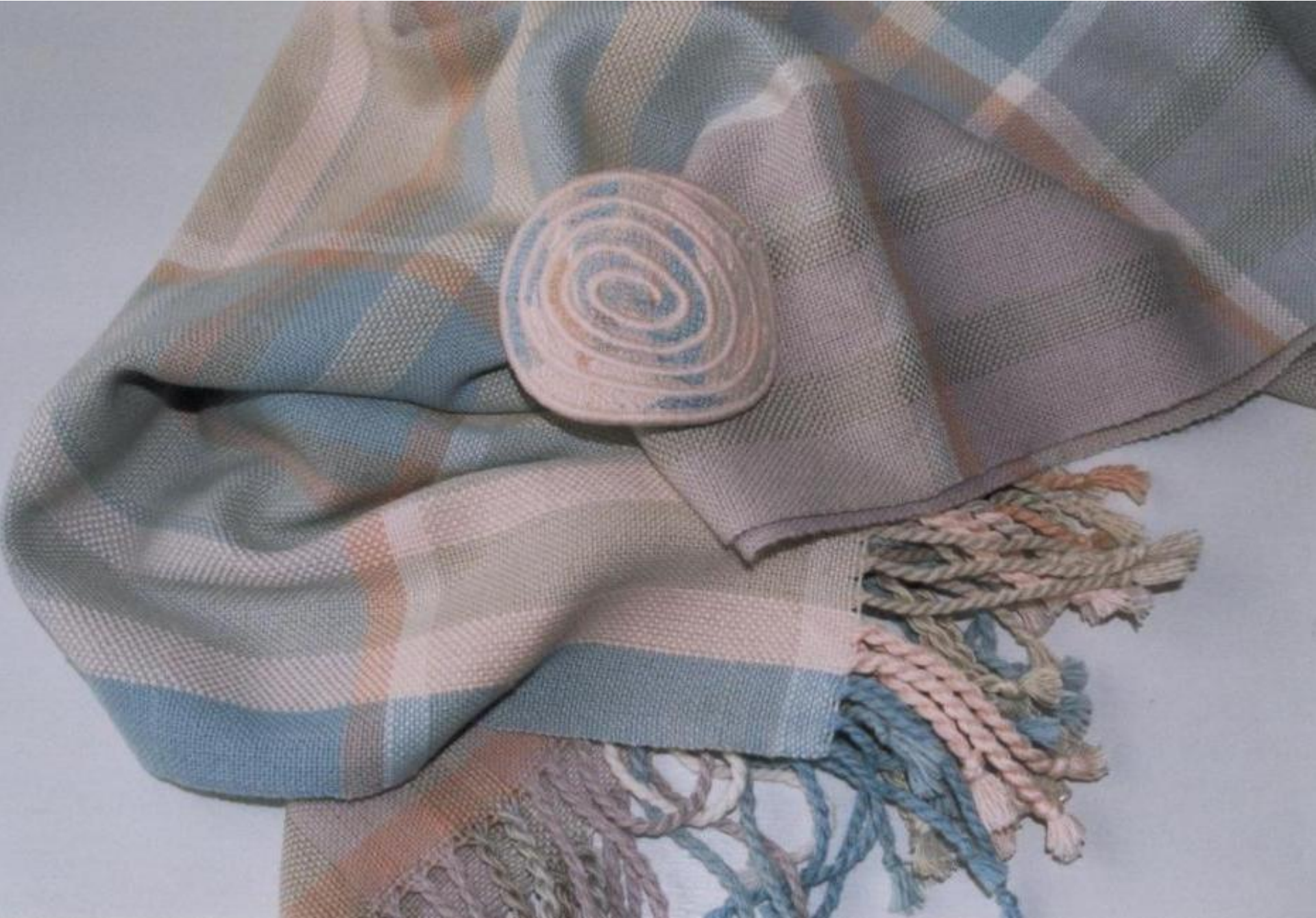
Sjaal - Linnenbinding, katoen.