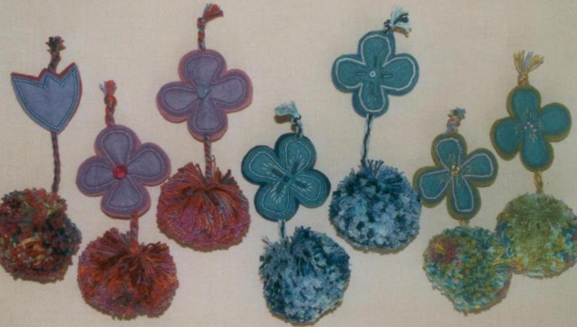
Pompoen van kettingresten en vilten bloem.