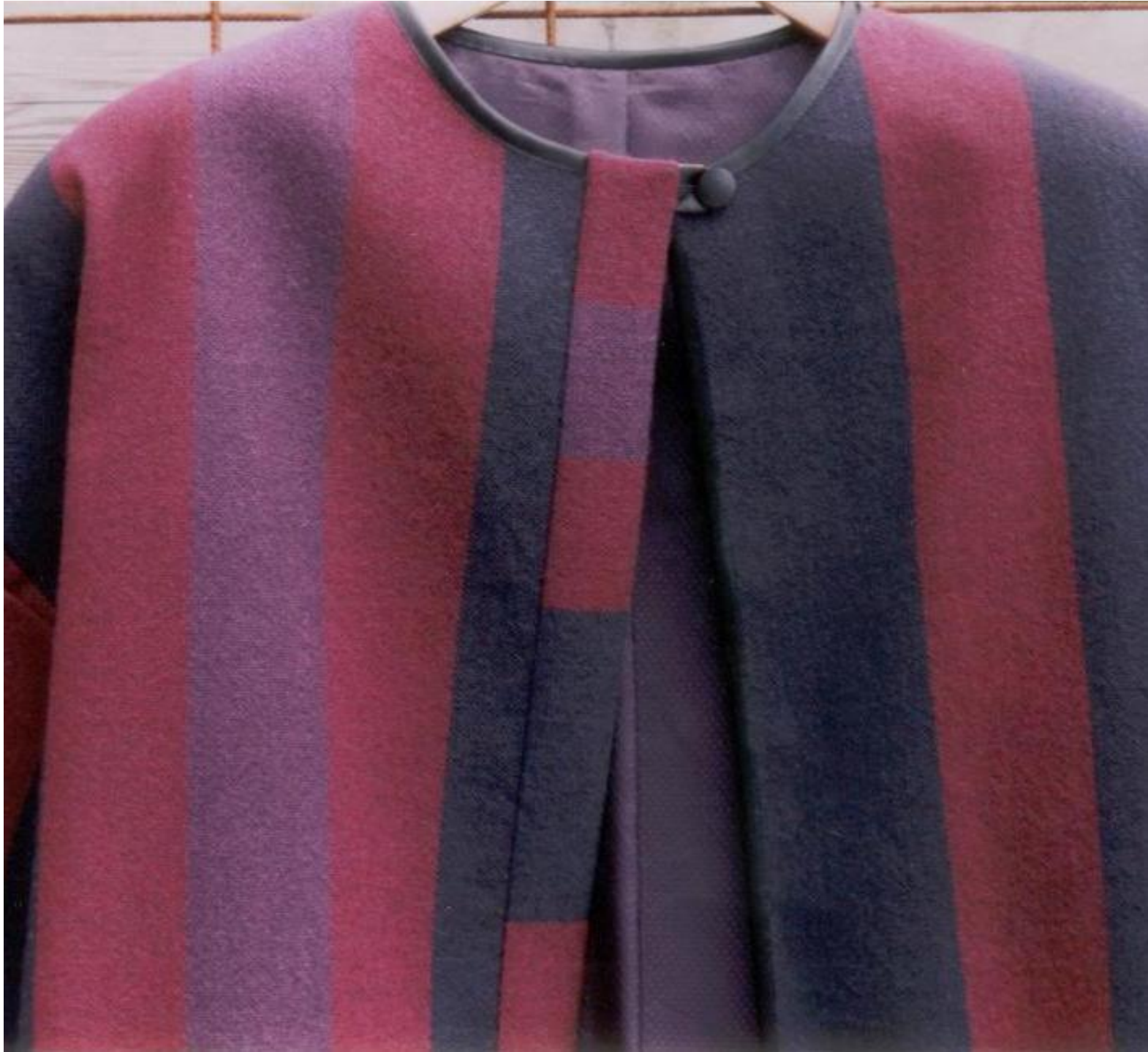
Jas Linnenbinding, wol.