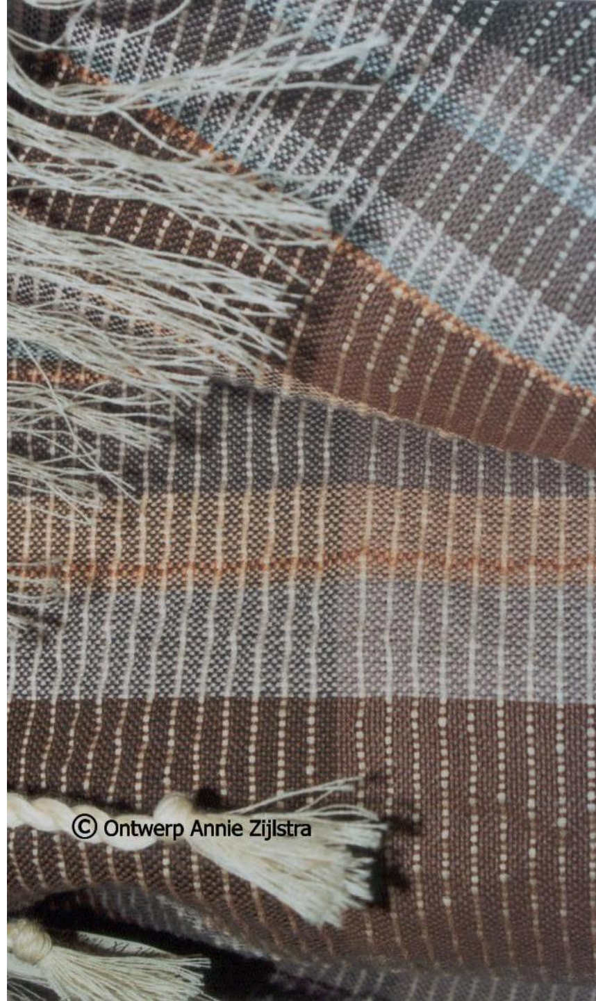
Levensdoek ' Door de grond ', van donker naar licht, 1994. Katoen en wol.