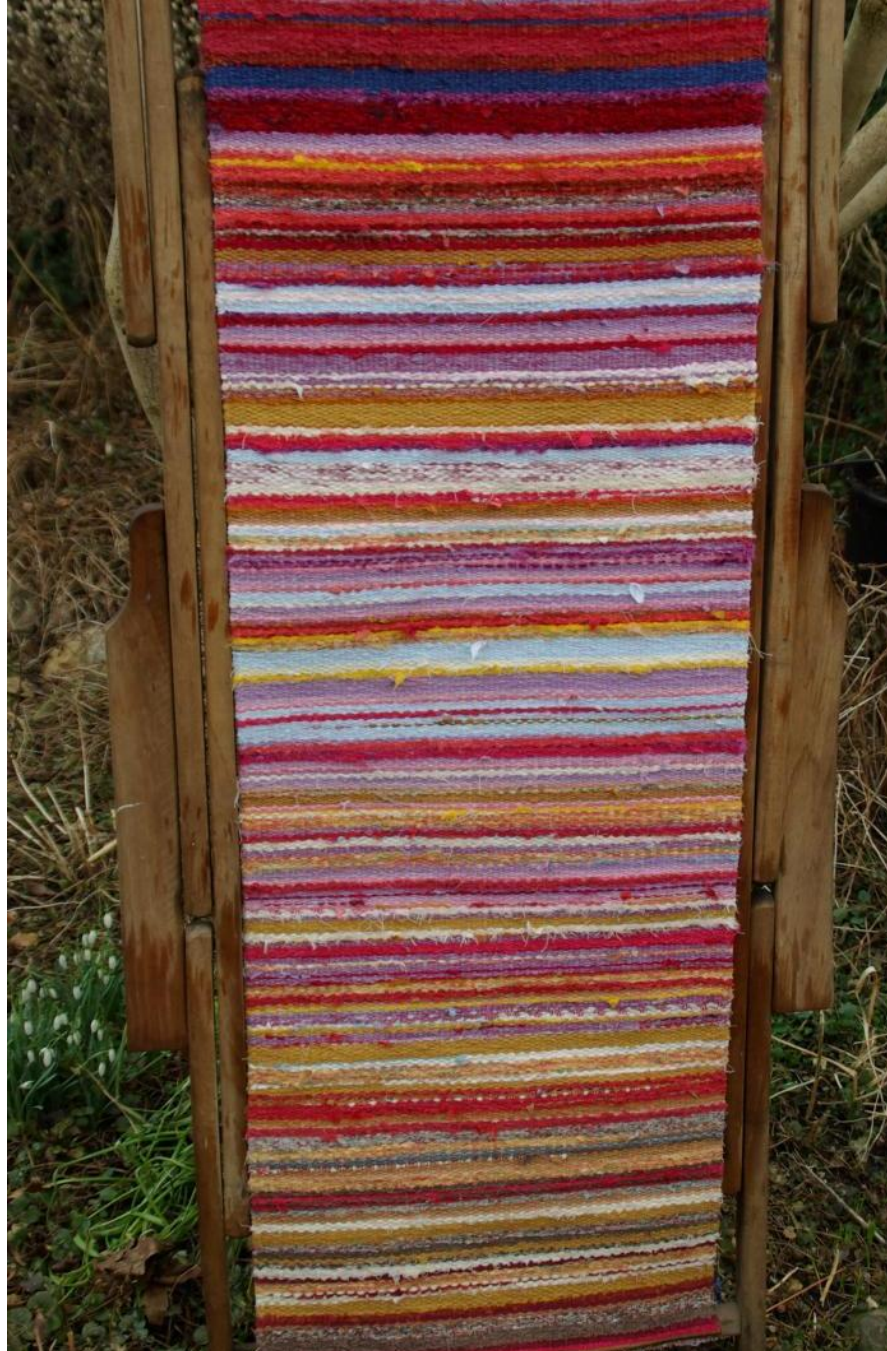
Bij de kringloop van het leven - 2011. Duurzame bronnen: de zon.