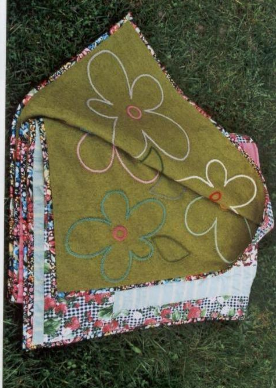
Levensdoek ' Geluk ' - 2008 - 2009. Geborduurd en gequilt.