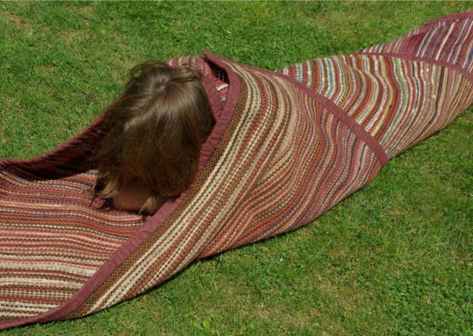
Wikkeldoek - rood, als alternatief voor een kist.