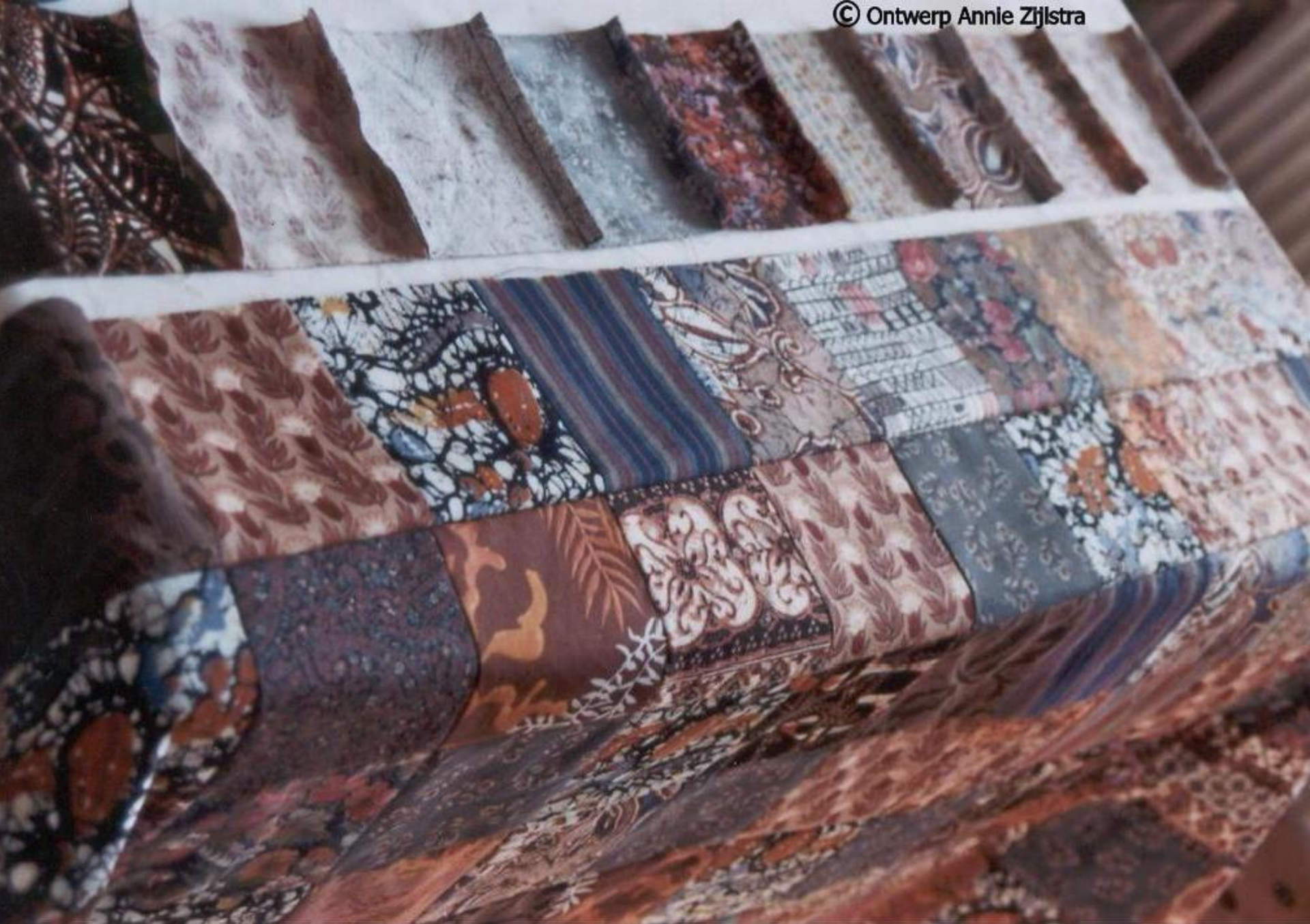
Levensdoek ' Hart ' - 2012. Quilt.