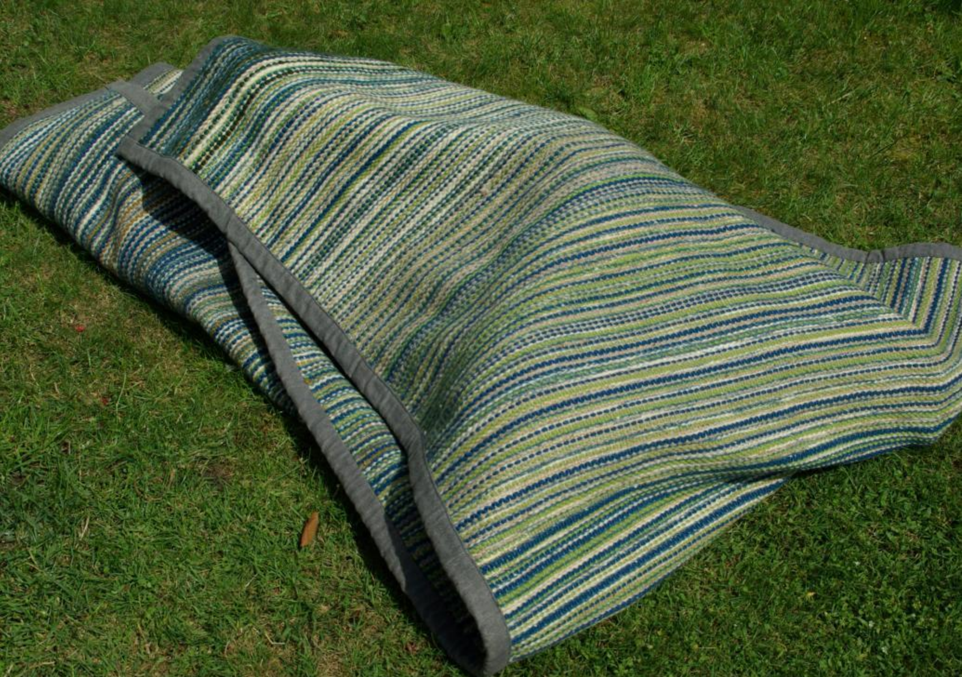
Wikkeldoek - groen, als alternatief voor een kist.